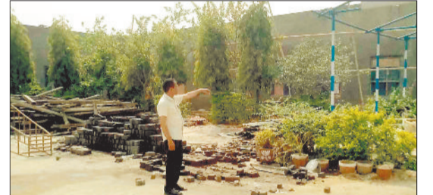
मजदूरों को निर्देशित करते स्कूल के प्राचार्य।

सरगुजा संभाग के सबसे पुराने शासकीय एडवर्ड हायर सेकेण्ड्री स्कूल के जर्जर भवन पर पहली बार शासन का ध्यान गया है। भवन निर्माण के 78 वर्षों बाद शासन द्वारा स्कूल जतन योजना के तहत स्कूल का कार्याकल्प कराया जा रहा है।