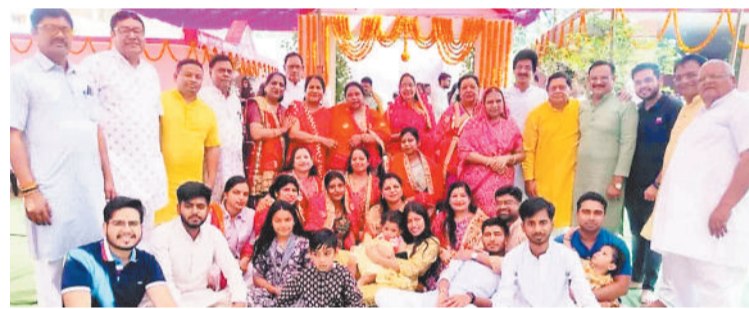
हरिभूमि न्यूज सूरजपुर